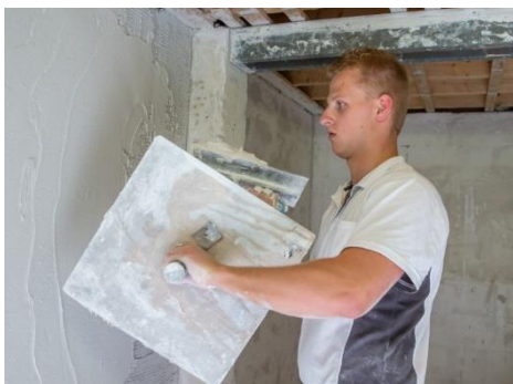
En jij kan dat!