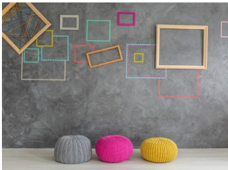
Mooie afgewerkte muren