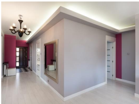
zorgen voor een afgewerkte look!